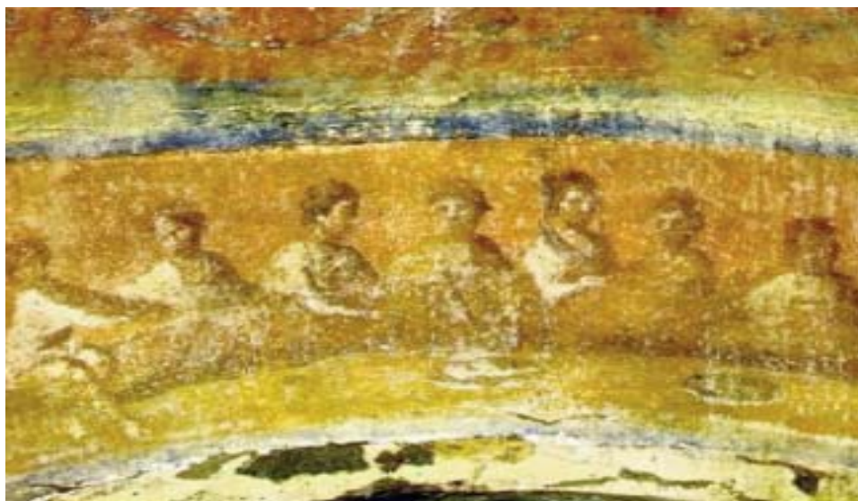
Primeros Cristianos. Catacumba de Santa Priscila (Roma) Siglo II d.c.